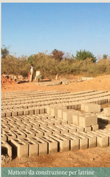
Mattoni da costruzione per latrine