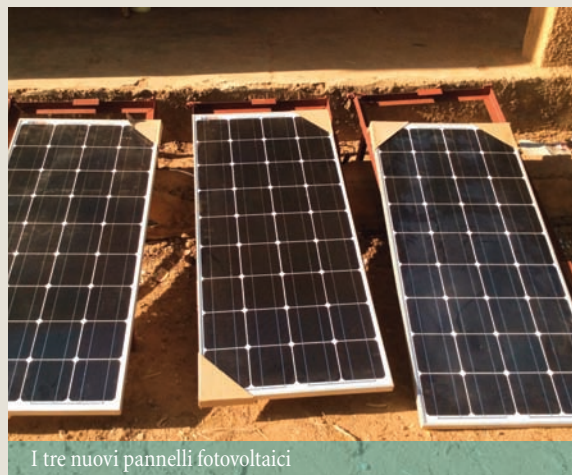
I tre nuovi pannelli fotovoltaici

Il team di Morija ringrazia i responsabili educativi, amministrativi e direttivi del CO de la Veveyse per il loro impegno nell'azione. Congratulazioni agli studenti del CO della Veveyse per la loro eccezionale mobilitazione e per coloro che li hanno sostenuti!