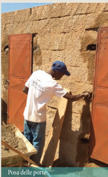
Posa delle porte