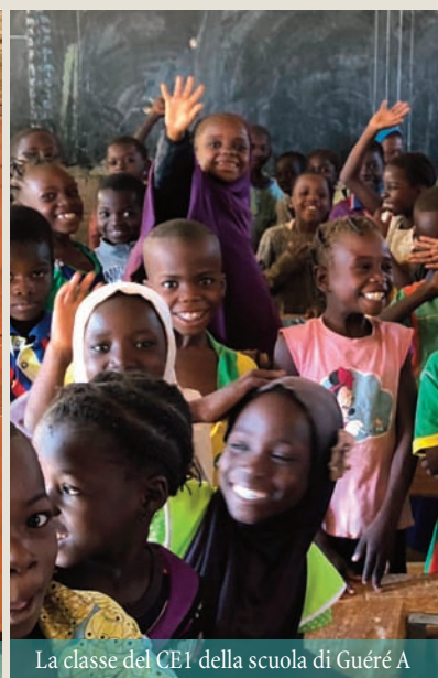
La classe del CE1 della scuola di Guéré A